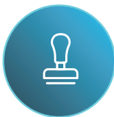
Estampado de anotaciones y numeración Bates