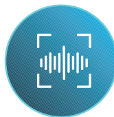
Guía de voz