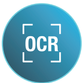
Reconocimiento óptico de caracteres

Los ciclos de trabajo más altos y los intervalos de mantenimiento periódicos proporcionan un mayor volumen con menos llamadas para mantenimiento de rutina, para mantener el enfoque en la productividad.